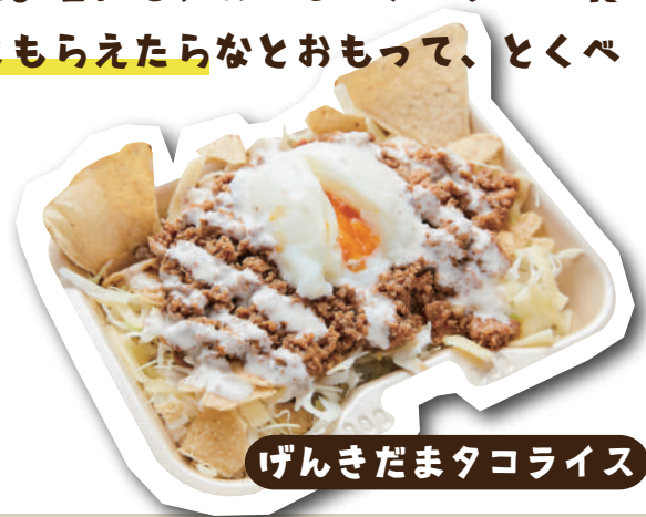
げんきだまタコライス

よのなか コロナコロナで、つらいおも いをしたり、 がまんすることが多い と思うけど、 おいしいご飯をたべて、やさしい気持ちになってもらえたら、ぼく らもうれしいよ。 お店でまってるよ。