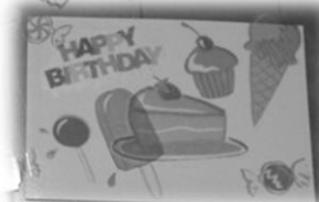
ステッカーアート作品例

※当日欠席のお知らせは 080-4172-3089 (ひとり親Tokyo携帯)まで