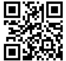
参加申し込み QRコード

参加を希望する方は、メールに[希望日][保護者氏名][お子様氏名(学年)][住所][電話番号][連絡先メールアドレス]を記載し、 kikaku@bgf.or.jp に送信してください。後日、参加決定のご案内を登録いただいた連絡先メールアドレスに送信します。