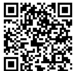
B&G 財団 Facebook